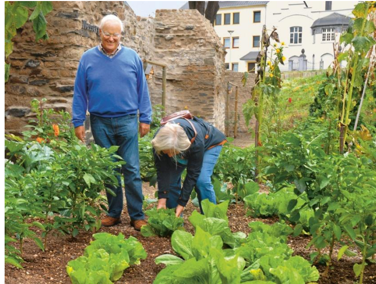
Urban-Gardening unterhalb der „Villa Berg“