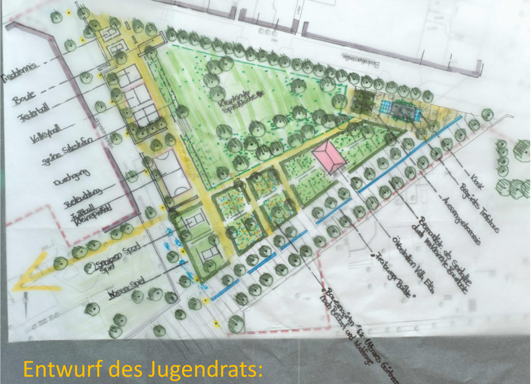
Entwurf des Jugendrats: