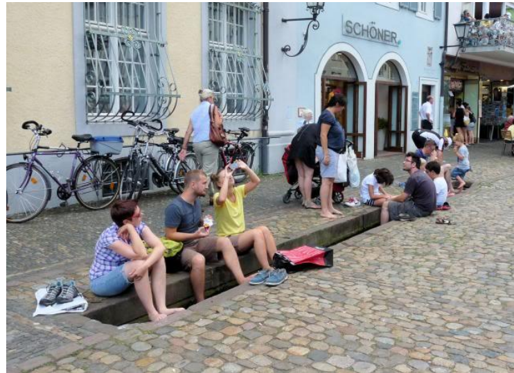
Wasserlauf entlang der Bismarckstraße