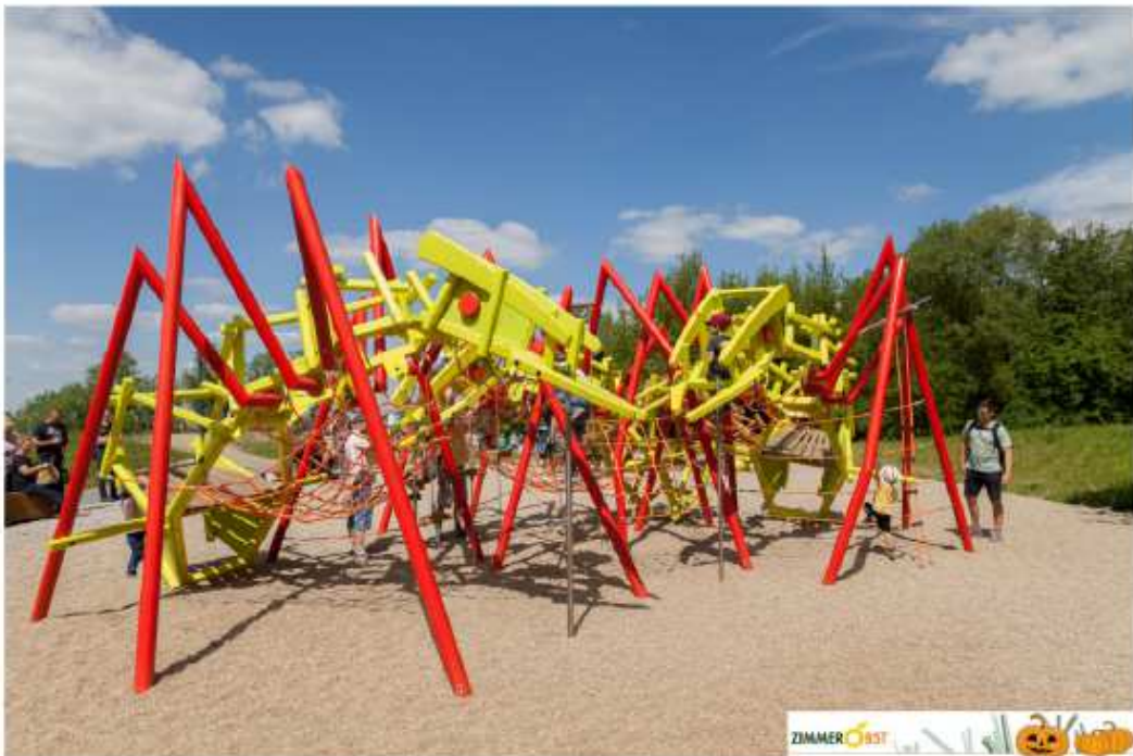
Variante 3 Kletterskulptur IGA2017 Riesennameisen (ZimmerObst GmbH Berlin)